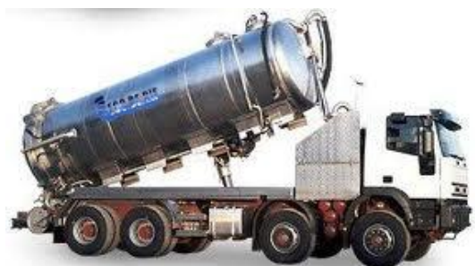
CAMION PER IL TRASPORTO DI SOSTANZE PERICOLOSE