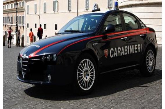
AUTO DEI CARBINIERI