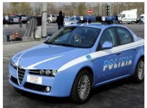
AUTO DELLA POLIZIA