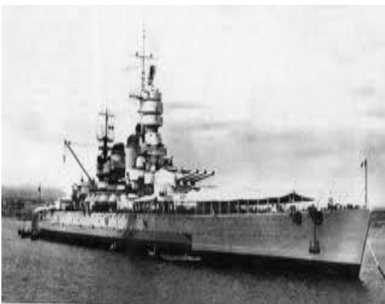
NAVE DA GUERRA