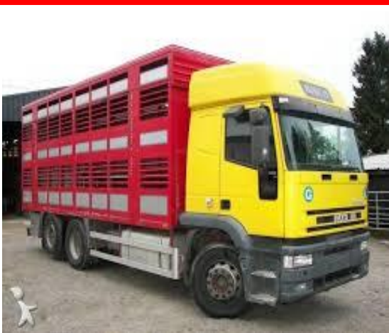
CAMION PER TRASPORTO ANIMALI