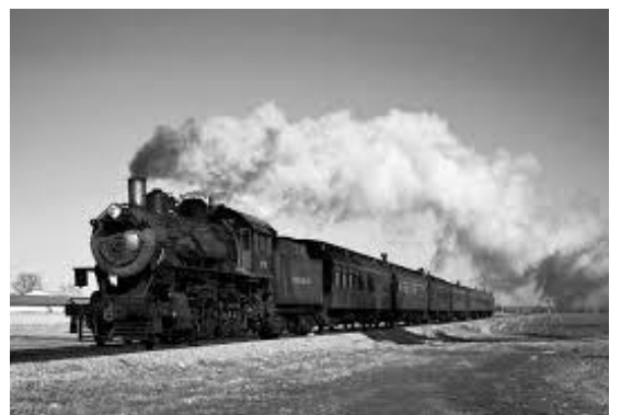
TRENO A VAPORE