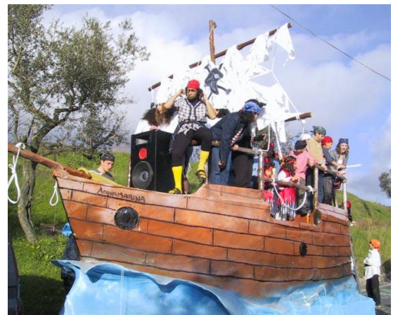
NAVE DEI PIRATI