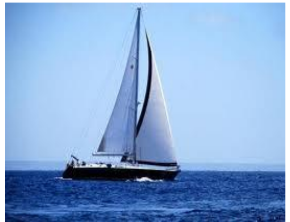
BARCA A VELA