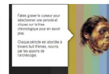
OUTILS (frises, cartes, lexique)