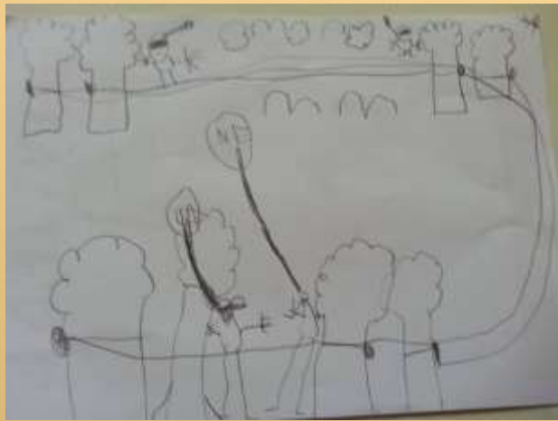
Odkrivanje in spoznavanje čustev v otroškem vrtcu Miškolin

z opazovanjem odraslih oz. njihovega nadzorovanja čustvenih stanj. Za otrokovo učenje pa je pomembno tudi besedno pojasnilo odraslih ob vsakodnevnih situacijah, kar še pospeši njegovo učenje.