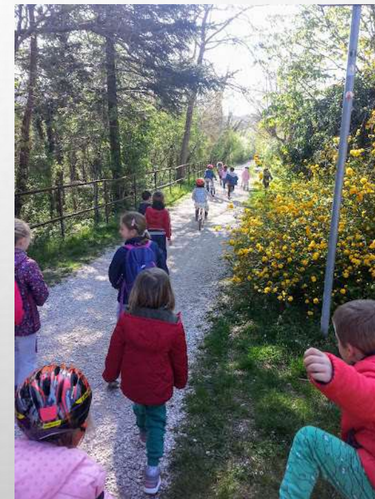
Odkrivanje in spoznavanje čustev v otroškem vrtcu Miškolin