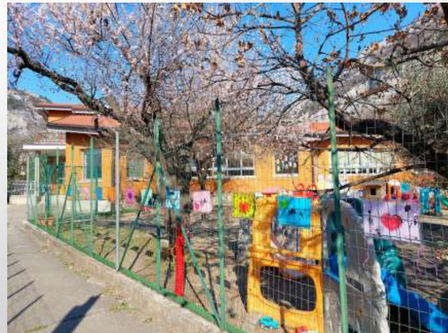
Odkrivanje in spoznavanje čustev v otroškem vrtcu Miškolin